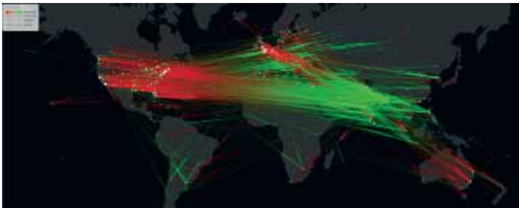
Grafico del flusso di progetti di outsourcing gestiti attraverso il sito freelancer.com nel 2011. In rosso le richieste delle aziende (situate quasi tutte negli Usa e in Europa), soddisfatte dai lavoratori nei Paesi in via di sviluppo (in verde), soprattutto India e Pakistan.